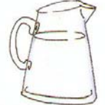
PITCHER LA JARRA