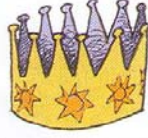
CROWN LA CORONA