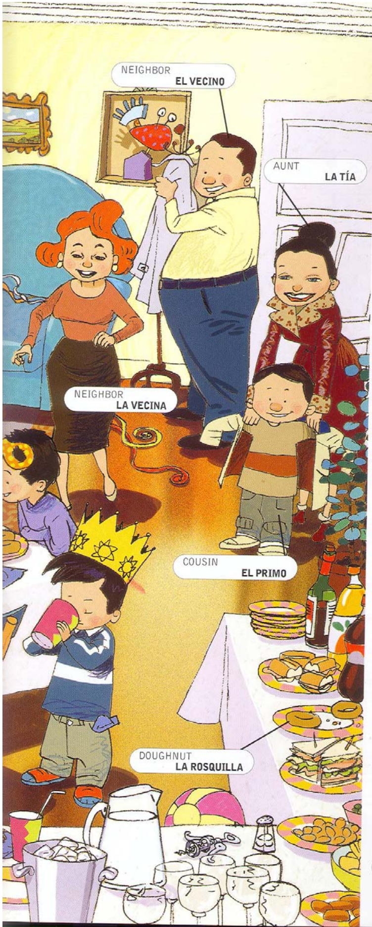
NEIGHBOR EL VECINO