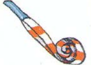
NOISEMAKER EL MATASUEGRAS