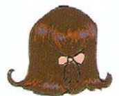
HAIR EL PELO