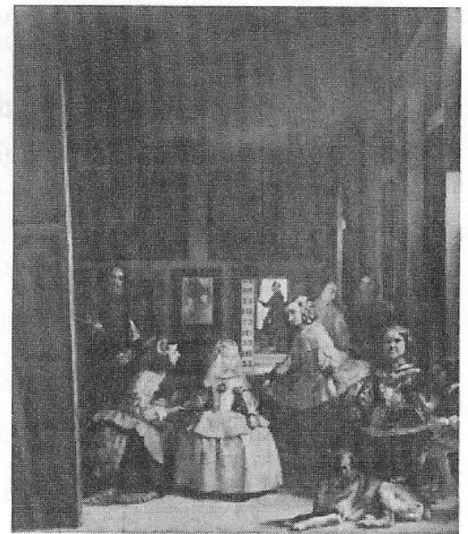
Las Meninas, Velázquez